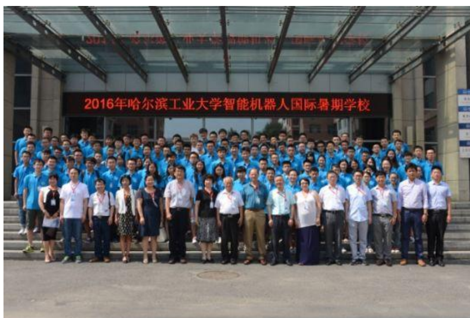
第一届哈工大“智能机器人”国际暑期学校开幕式合影