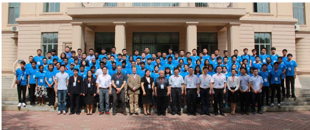
第二届哈工大“智能机器人”国际暑期学校开幕式合影