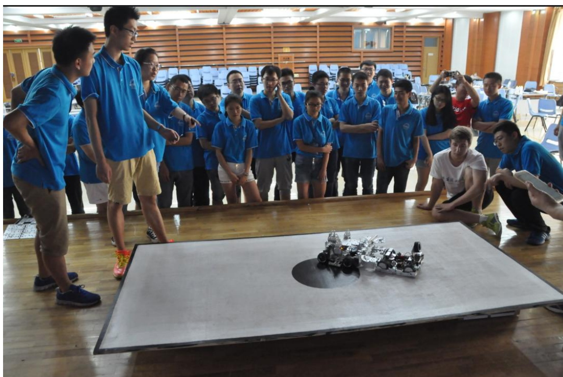
哈工大“智能机器人”国际暑期学校机器人对抗赛掠影