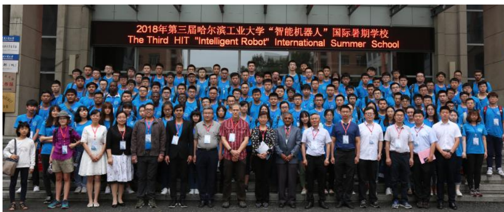
第三届哈工大“智能机器人”国际暑期学校开幕式合影