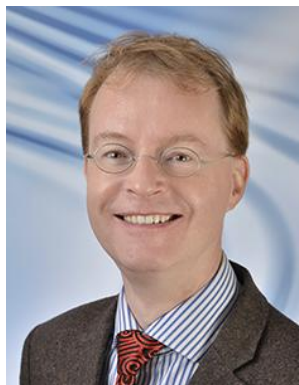
Jörn Mehne 教授

工程管理系科研主任，物联网实验室副主任。他是物联网安全基金会成员，IEEE 会员，西门子 HEEDS 事业部顾问委员会成员，ISF 科学助理，多特蒙德技术大学客座教师，同时是多个国际著名期刊编辑。在工业 4.0，信息物理系统，大数据以及物联网领域作出过卓越贡献，在相关领域发表 120 余篇出版物，包括 4 本专著。他还参加过近百次国际学术交流。