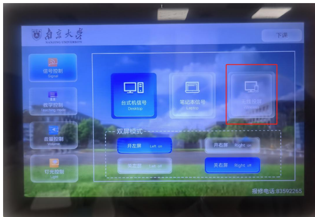
图1 墙上中控：“无线投屏”