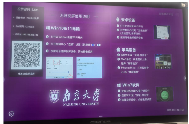
图2 电子屏：无线投屏使用说明