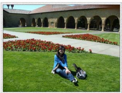
在斯坦福大学的草坪上

国外高校对保险都比较重视,都会要求交换生办理相关保险业务。国内办理的保险在国外一般没有效力,所以需要购买国外的保险。购买保险可以先在国内打听清楚,查明相关讯息,到国外后即可购买办理。