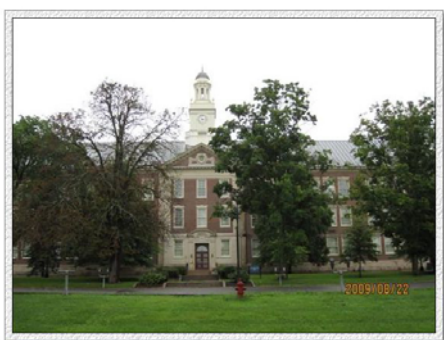
纽约州立大学新堡分校风景