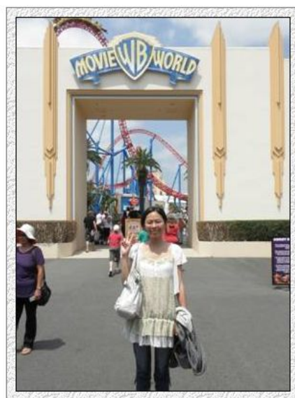
在澳大利亚的电影世界