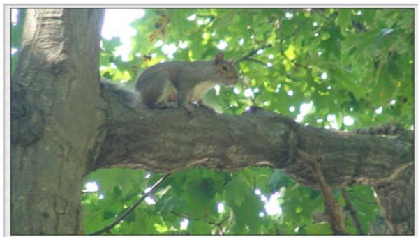
纽约州立大学石溪分校内的小松鼠